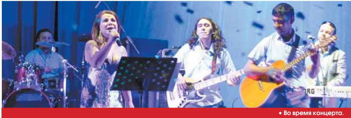
• Во время концерта.

«Звезда» Средней Азии Юлдуз Усманова — в Хабаровске