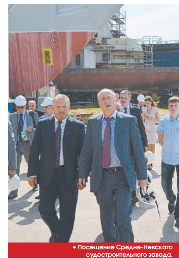
• Посещение Средне-Невского судостроительного завода.

в Санкт-Петербурге станет рост инвестиций в экономику региона