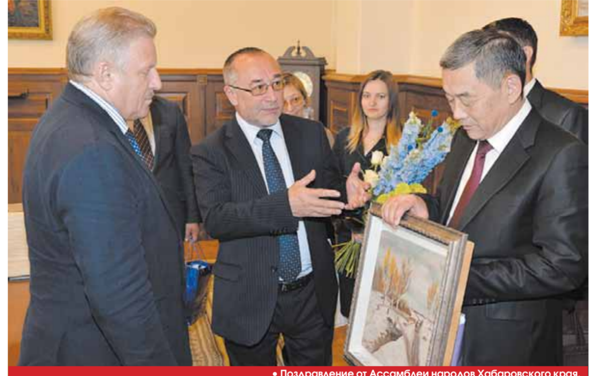
• Поздравление от Ассамблеи народов Хабаровского края.

Во второй половине дня, вернувшись в краевой центр, губернатор встретился с теми, кто посчитал за честь поздравить его — от души, от сердца... с юбилеем и напомнить, что 60 лет — это возраст расцвета человеческой мысли, основанной на богатом жизненном опыте.