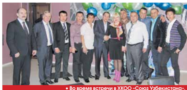
• Во время встречи в ХКОО «Союз Узбекистана».

А если все же человек попал в беду — здесь всегда пойдут навстречу и подыдут к возникшей проблеме со всей ответственностью