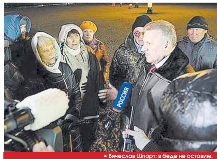
• Вячеслав Шпорт: в беде не оставим.

Масштабные работы по строительству жилья для пострадавших от прошлогоднего паводка в Хабаровском крае развернуты в селе Бельго, которое было полностью затоплено в результате наводнения. На средства, собранные в ходе благотворительного телемарафона Первого канала, здесь будет построено 88 домов. Работы ведутся на специально отсыпанной площадке, высота которой позволяет избежать подтопления.