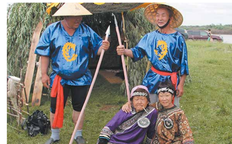
• Летнее жилище нанайцев.

Много добрых, теплых слов и пожеланий было сказано в адрес дадинцев и их родного села, много наград и подарков вручено. Подведены итоги нескольких конкурсов, объявленных в Даде к ее юбилею.