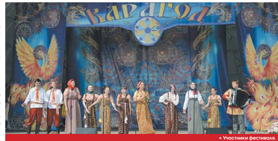
• Участники фестиваля.

Фестиваль затрагивает все грани жизнедеятельности народов, представляющих свою культуру на нашей хабаровской земле. В рамках этого праздника национального искусства