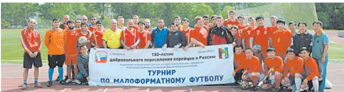
• Участники турнира.

На стадионе «Юность» состоялся турнир по малоформатному футболу среди команд национальных центров Хабаровска, приуроченный празднованию 150-летия переселения корейцев в Россию.