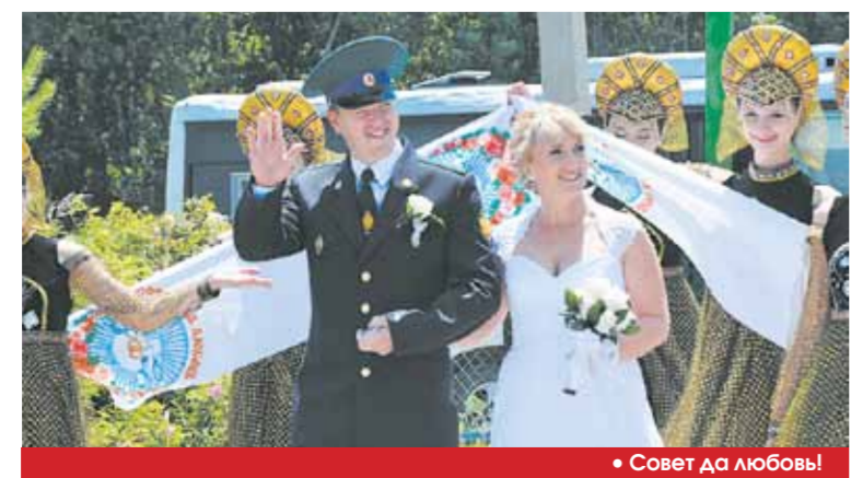
• Совет да любви!