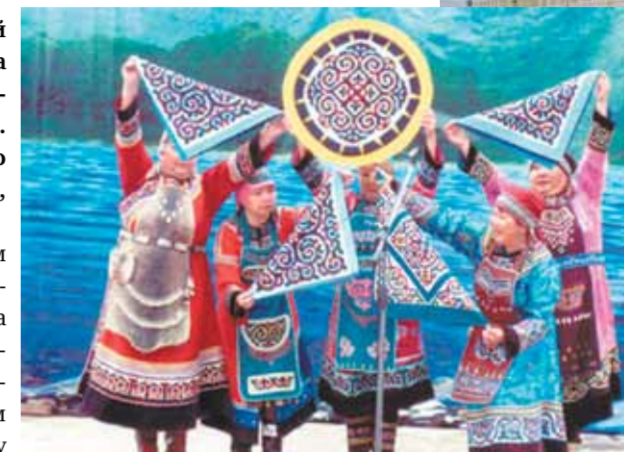
• Народный фольклор.

Поначалу крестьяне занимались хлебопашеством. Именно нанайцы научили их промышлять невиданным в среднерусских реках рыбу — кету. Главными занятиями жителей Троицкого становятся охота и рыболовство.