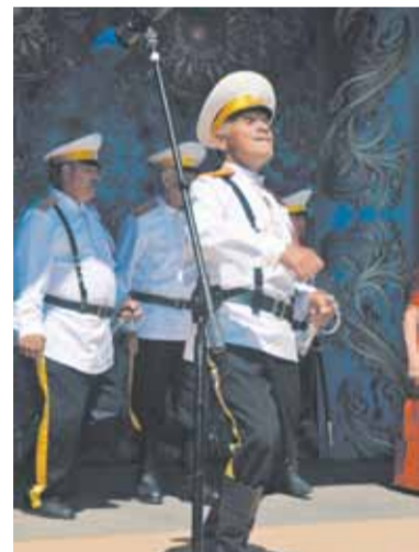
• Народный ансамбль казачьей песни «С песней жить!».

Как сказал губернатор В. Шпорт, приветствуя участников и зрителей этого масштабного культурного мероприятия, Хабаровский край является одним из крупнейших регионов России, занимаю по территории четвертое место в стране. «Мы гордимся своим краем и живущими здесь людьми», — отметил Вячеслав Иванович.