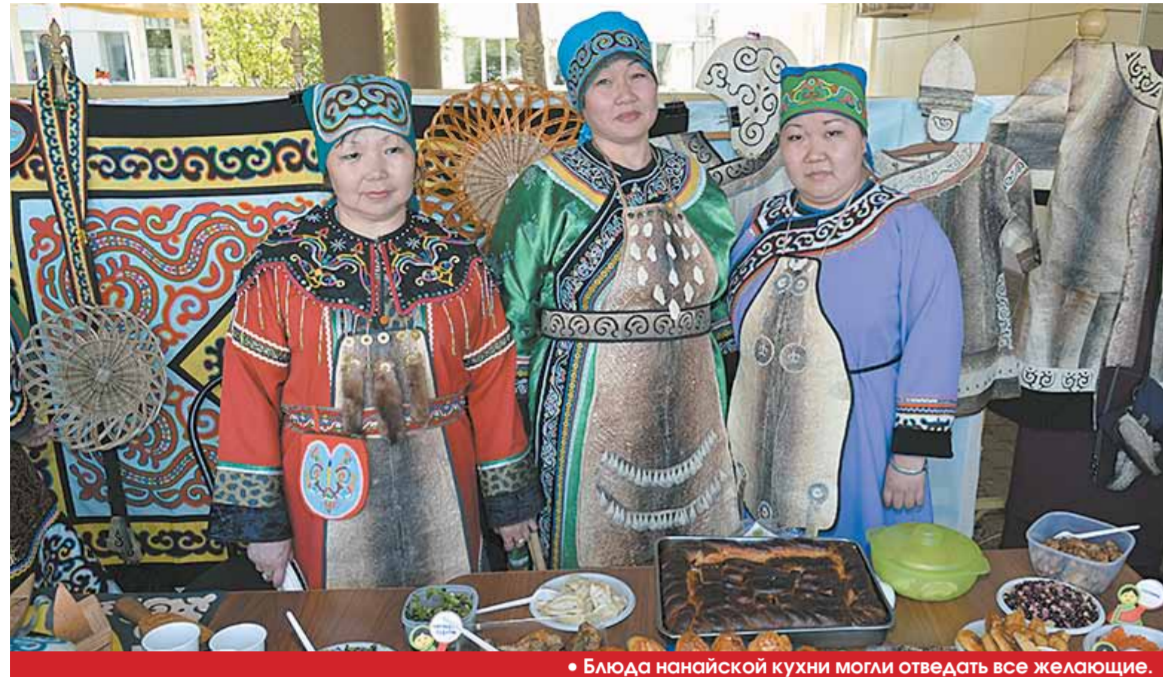
• Блюда нанайской кухни могли отведать все желающие.

В рамках празднования Дня России на базе краевого Дворца культуры и спорта «Русь» прошел IV краевой фестиваль музыки и песни народов, проживающих в нашем регионе, «Карагод».